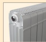
Τύπος Flat Αυτόματο εξαεριστικό