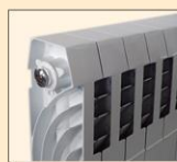
Τύπος Classic Αυτόματο εξαεριστικό

Τα θερμαντικά σώματα magma συνοδεύονται από ένα αυτόματο εξαεριστήρακι 1/2", μία τάπα 1/2" και τα απαραίτητα στηρίγματα. Μπορούν να εγκατασταθούν σε μονοσωληνίο ή δισωληνίο σύστημα, με σύνδεση απο δεξιά ή αριστερά (επιλογή κατά την τοποθέτηση).